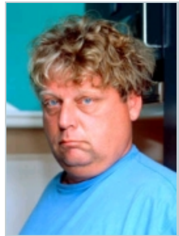
Theo van Gogh

dat de hiervoor genoemde denkers niet 'beledigden' of dat zij geen godsdienstige gevoelens hebben gekrenkt. Wat je wel kunt zeggen, is dat zij in eerste instantie een bijdrage hebben willen leveren aan de vermeerdering van de kennis van de mensheid. De meest zachtmoedige karakters onder hen hebben ernstig geworsteld met de wetenschap dat zij hiermee anderen zouden krenken. Het meest aandoenlijke voorbeeld daaraan vind ik nog altijd Charles Darwin. 31 Darwin realiseerde zich dat zijn evolutieleer grote delen van het evangelie, met name Genesis, obsoleet zou maken of doen vervluchtigen tot niet-historische verhalen. Hij stelde de publicatie van On the Origin of Species om die reden steeds maar uit. Hij wilde ook de religieuze gevoelens van zijn eigen vrouw ontzien. Uiteindelijk meende hij echter toch tot publicatie van zijn bevindingen te moeten overgaan. Het resultaat is bekend. Zijn volgeling T.H. Huxley deed het zware werk voor hem. 'Darwin's